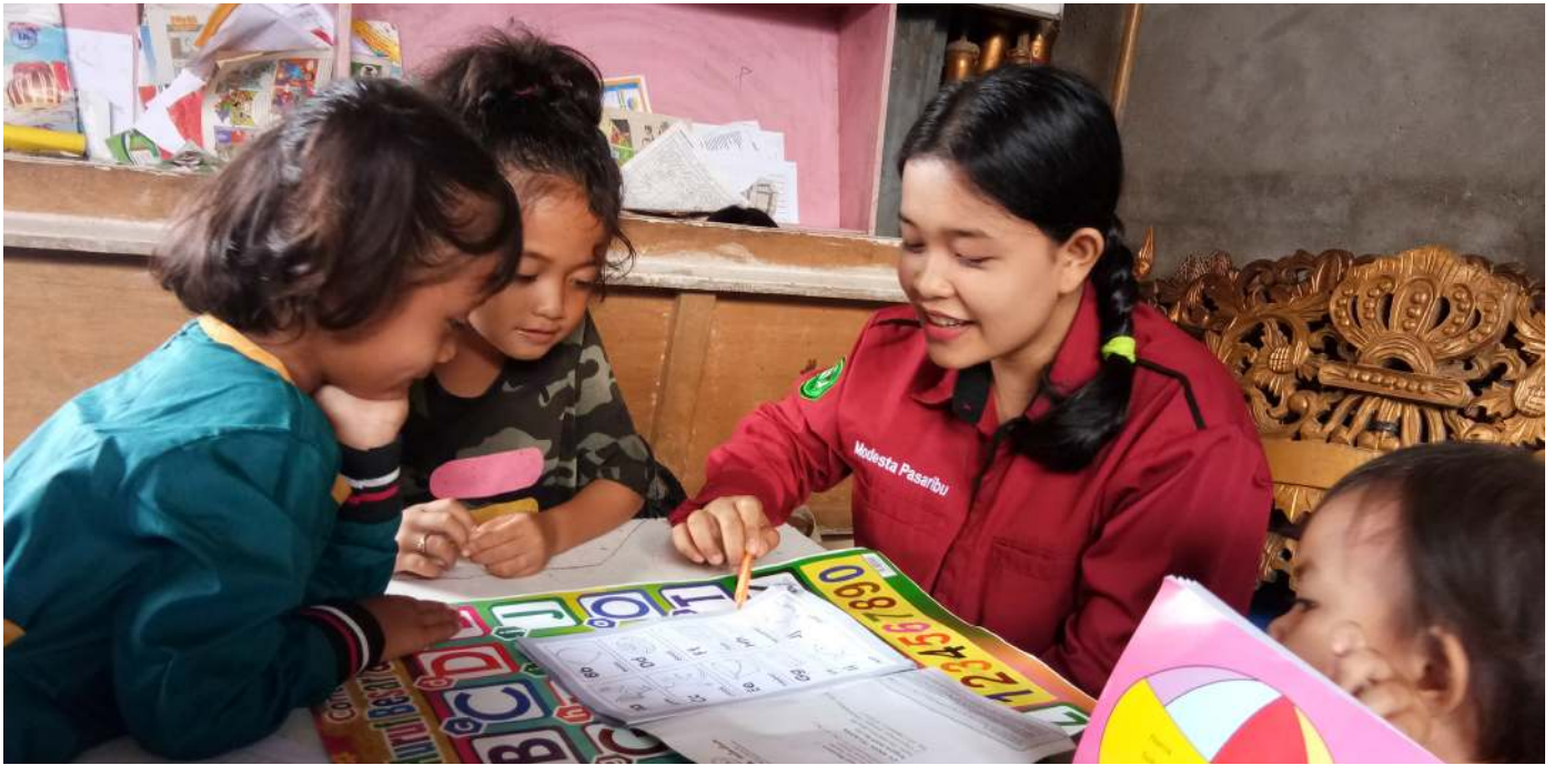
Penerima program kepemimpinan Tanoto Foundation atau biasa disebut Tanoto Scholars secara rutin mengadakan program pemberdayaan masyarakat seperti mengajar.