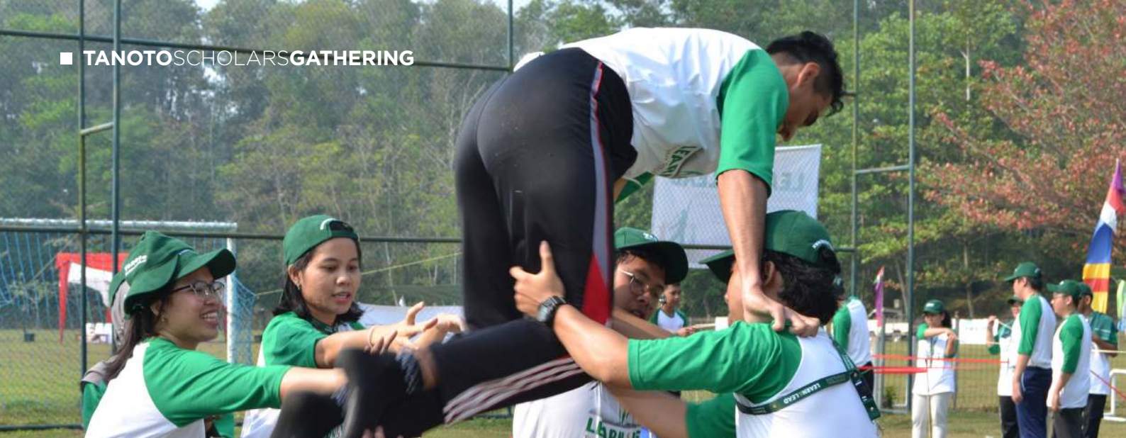
Tanoto Scholars bekerja sama dalam kegiatan outbound di Tanoto Scholars Gathering 2019 untuk melatih kerja sama dan jiwa kepemimpinan mereka.